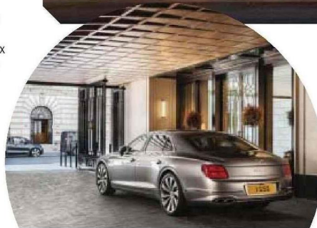
Résidence 1 Grosvenor Square, à Mayfair. L'ex-ambassade des Etats-Unis abrite notamment un penthouse valant 100 000 euros le m 2 .

de livres sterling dans la capitale britannique a atteint son plus haut niveau depuis huit ans, avec 175 transactions à fin novembre sur les douze derniers mois. Et les projets se poursuivent, tel celui de Chelsea Barracks à Belgravia. Cette ancienne caserne militaire de 51 hectares avec club privé et espaces verts abrite 448 logements, du studio de 90 m 2 à la maison de 1 500 m 2 aux prestations du même acabit. La dernière maison (8 chambres, piscine privée et rooftop) a été mise en vente... 70 millions d'euros. ■